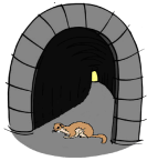
LES FOUINEURS BÉDOUINS

L'association « Les Fouineurs Bédouins » existe depuis 2005, et, depuis elle travaille sur un certain nombre de projets pour laisser des traces écrites ou visuelles dans le village.